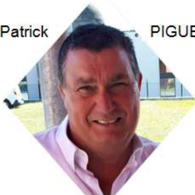
Président du Secteur Bouliste Bressan